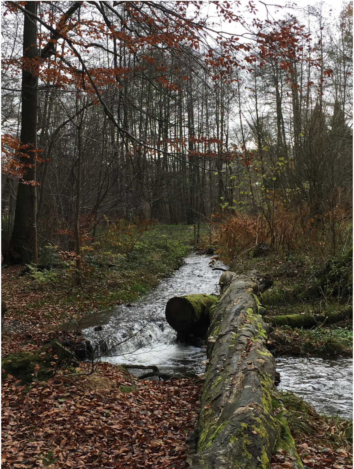
Die Pöltzsch am Poetenweg